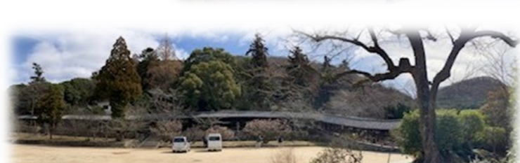
待望の回廊です。見事でした！！