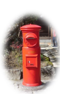
ぽつんとポストが??