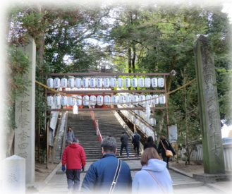
この階段を上ってお参り

以前雑誌で吉備津神社の回廊を見に行ってみよう！！回廊を歩いてみたいと思っていました。2月下旬に機会があり吉備津神社に行ってみようということで、三田を8時過ぎに出発しました。神社に着いたのは11時頃。拝殿にお参りするの階段を上って行きました。当日はお宮参りとか、結婚式の前撮りをされている方など沢山の方がお参りに来られていました。ここは学業成就の守り神として知られていて、学生さんがお参りしておられました。でもやっぱり長い回廊は素晴らしかったです。瓦屋根の廊下がず〜と続いており途中梅が咲いてたり、きれいなお庭があったりと、ゆっくりした時間を過ごしました。(吉備津神社は岡山市北区吉備津にあります。)