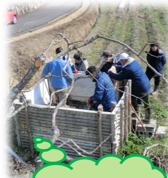
堆肥を作っています。